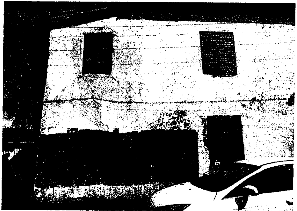
Фото 4. Фрагмент южного фасада (лит. В)