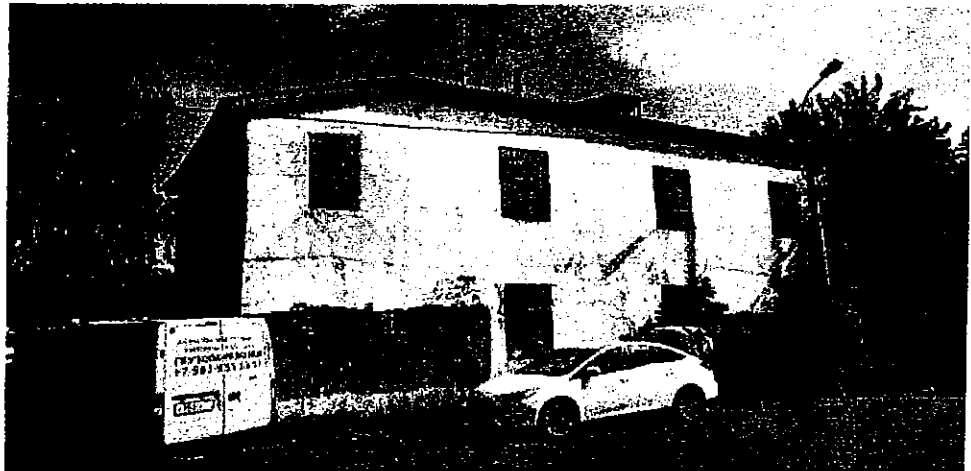
Фото 1. Вид с юго-запада (лит. В)

Фотографическое (иное графическое) изображение объекта культурного наследия (на момент утверждения охранного обязательства) объект культурного наследия регионального значения «Пробная галерея Оружейного завода», XVIII в., Тульская область, г. Тула, Пролетарский район, Демидовская плотина, д.13 лит. А, Б, В1, В2, В1, В2, д.15 лит. В