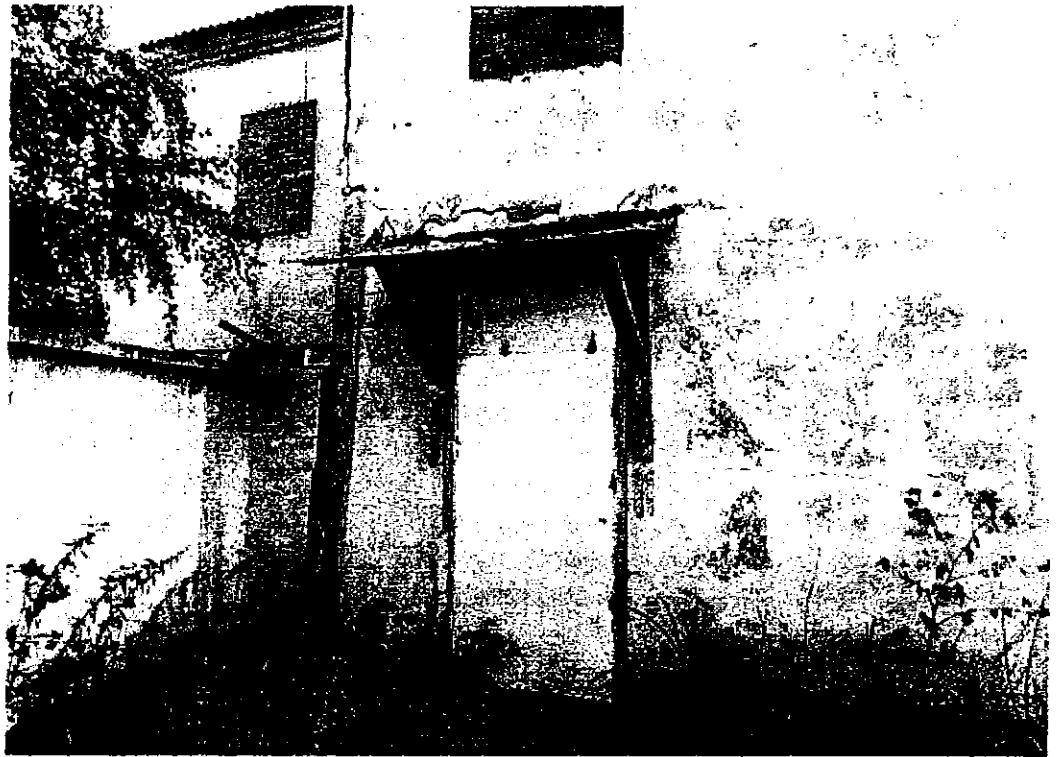
Фото 3. Фрагмент западного фасада (лит. В)