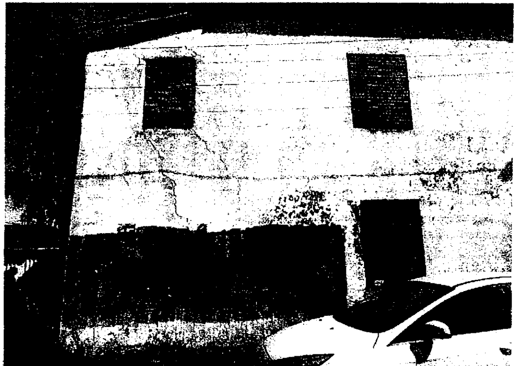
Фото 4. Фрагмент южного фасада (лит. В)