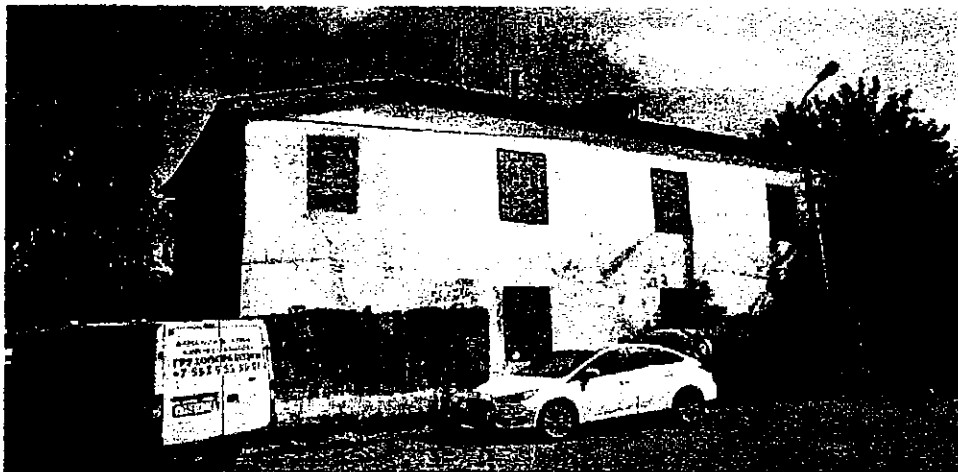
Фото 1. Вид с юго-запада (лит. В)

Фотографическое (иное графическое) изображение объекта культурного наследия (на момент утверждения охранного обязательства) объект культурного наследия регионального значения «Пробная галерея Оружейного завода», XVIII в., Тульская область, г. Тула, Пролетарский район, Демидовская плотина, д.13 лит. А, Б, В1, В2, В1, В2, д.15 лит. В