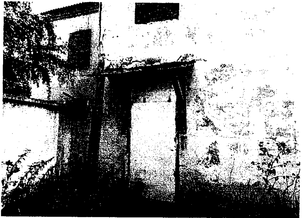
Фото 3. Фрагмент западного фасада (лит. В)