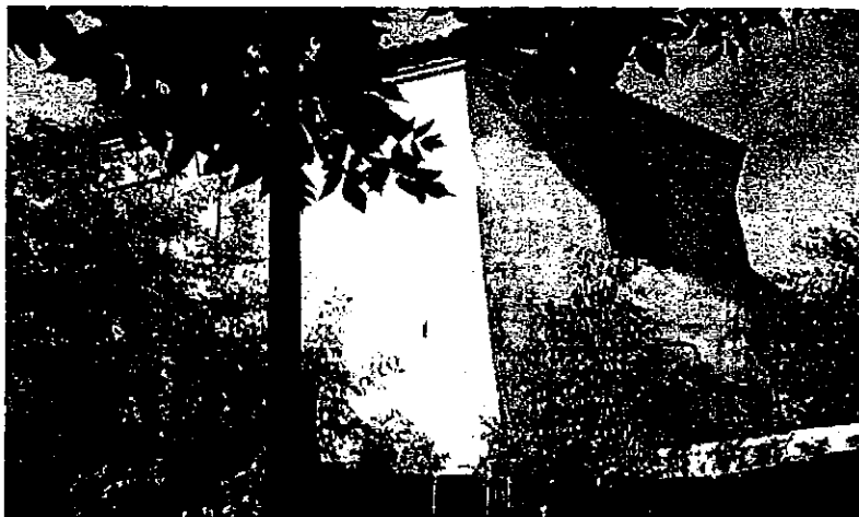
Фото 2. Вид с северо-востока (лит. В)